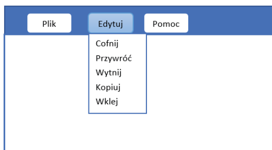
Rysunek 3. Okno menu tworzonej aplikacji